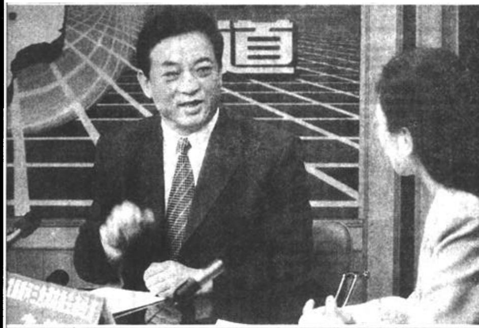
图为市委书记石军就发展黄河三角洲高效生态经济接受新闻媒体的联合专访。

本报讯 在刚刚结束的九届全国人大四次会议上，“发展黄河三角洲高效生态经济”列入了国家“十五”计划纲要，正式进入了国家级决策，使全市人民深受鼓舞。3月22日上午，市委书记石军就此在东营电视台演播室接受了市新闻记者的采访。 石军首先谈起了“发展黄河三角洲高效生态经济”进入国家“十五”计划纲要的重要意义，他说，我们从建国到现在，奋斗了十八年，期盼了十八年，要求进入国家决策，就是因为其对东营市乃至整个黄河三角洲的建设和发展具有巨大的推动作用。具体来说，主要体现在四个方面：一是这次把黄河三角洲与长江三角洲、珠江三角洲并列提出来，可以在国内外大大提高黄河三角洲的知名度，对我们走向世界大有好处。二是确定在黄河三角洲发展高效生态经济，对于发展石油石化替代产业具有重大推动作用。工业、农业、第三产业齐头并进，特别是高效益、高科技、高市场占有率的产业发展上去了，我们抗风险的能力就会大大增强，就会促进东营经济的持续、快速、健康发展。三是可以尽快实现江总书记对我们的殷切期望和要求。江总书记视察东营时，对我们既有殷切期望，又提出了明确的方向性要求。黄河三角洲高效生态经济列入国家“十五”计划，对我们实现江总书记的要求，把黄河三角洲建设成为环境优美、经济繁荣的新经济区，将是很大的促进和推动。四是黄河三角洲的发展进入国家级决策，我们就可以在国内外宣传东营，争取各方面的支持；就可以巧妙地运用杠杆的原理，把生产要素撬到东营来，加快发展。石军指出，选择我们这个区域发展高效生态经济，就是要借鉴通过深圳、珠海、浦东开发带动长江三角洲的经验，在我们这个生态完整、资源密集、生态环境比较好的区域内，集中力量、重点突破、取得经验，然后推广之。它关系到整个黄河三角洲开发，对山东乃至全国也具有示范作用，因此，我们只能做好不能做差。 对今后发展黄河三角洲高效生态经济的设想和打算，石军说，目前，高效生态经济的发展规划已经初步编制出来。将在5、6月份，进行进一步专家论证后，正式确定下来，作为长期的发展规划。这个规划大体上，从今年开始，用10年时间，通过全市人民的奋斗，把东营建成环境优美、经济繁荣的新经济区。具体来说，前两年打基础，再用三年上水平，后五年展开翅膀腾飞，尽快达到目标。“高效生态经济”，“环境优美、经济繁荣”，它的内涵是什么？如何来规划这个目标？我们要请专家来论证，还要征求群众的意见。但最起码要有三个方面：一是经济要更快更好地发展。每年的主要经济指标要保持或超过全省平均水平，增幅要超过3至5个百分点，以更快的速度、更高的质量发展。二是环境要更美。我们一手治理过去的污染，一手把好关，新发展的项目必须没有污染，尽可能是高科技项目。三是人民生活有明显改善。我们的初步设想是要在全省平均水平以上。我们发展高效生态经济，建设环境优美、经济繁荣的新经济区，必须以改善和提高人民生活水平为根本出发点和落脚点。 石军指出，发展黄河三角洲高效生态经济是巨大的系统工程。争取起来不容易，运作起来更难。我们既要立足东营实际，更要站在时代的高度，从全球的角度来考虑我们战略的思想，战略的部署和运作方式。我们的指导方针就是，认真贯彻落实党的十五届五中全会和这次全国人代会的精神，以经济建设为中心，以经济结构调整为主线，以改革开放和科技进步为动力，以提高人民生活水平为根本出发点，把经济、社会、环境紧密结合起来，推动高效生态经济的建设和发展。 (下转第二版)