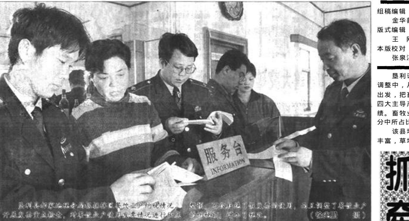
按照省政府和市委、市政府的工作部署，今年的卫生工作应重点抓好城镇医药卫生体制改革、农村卫生工作、预防保健工作、无偿献血工作、卫生行业精神文明建设等各项工作。

按照省政府和市委、市政府的工作部署，今年的卫生工作应重点抓好城镇医药卫生体制改革、农村卫生工作、预防保健工作、无偿献血工作、卫生行业精神文明建设等各项工作；要加强领导，落实责任，为卫生改革与发展提供坚实保障。今年是“十五”计划的开局之年，卫生改革与发展的任务十分繁重。各级政府要把卫生工作列入重要议事日程，统筹考虑，周密安排，积极稳妥地推进卫生改革。各有关部门要